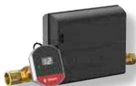
Flexcon PA AutoFill